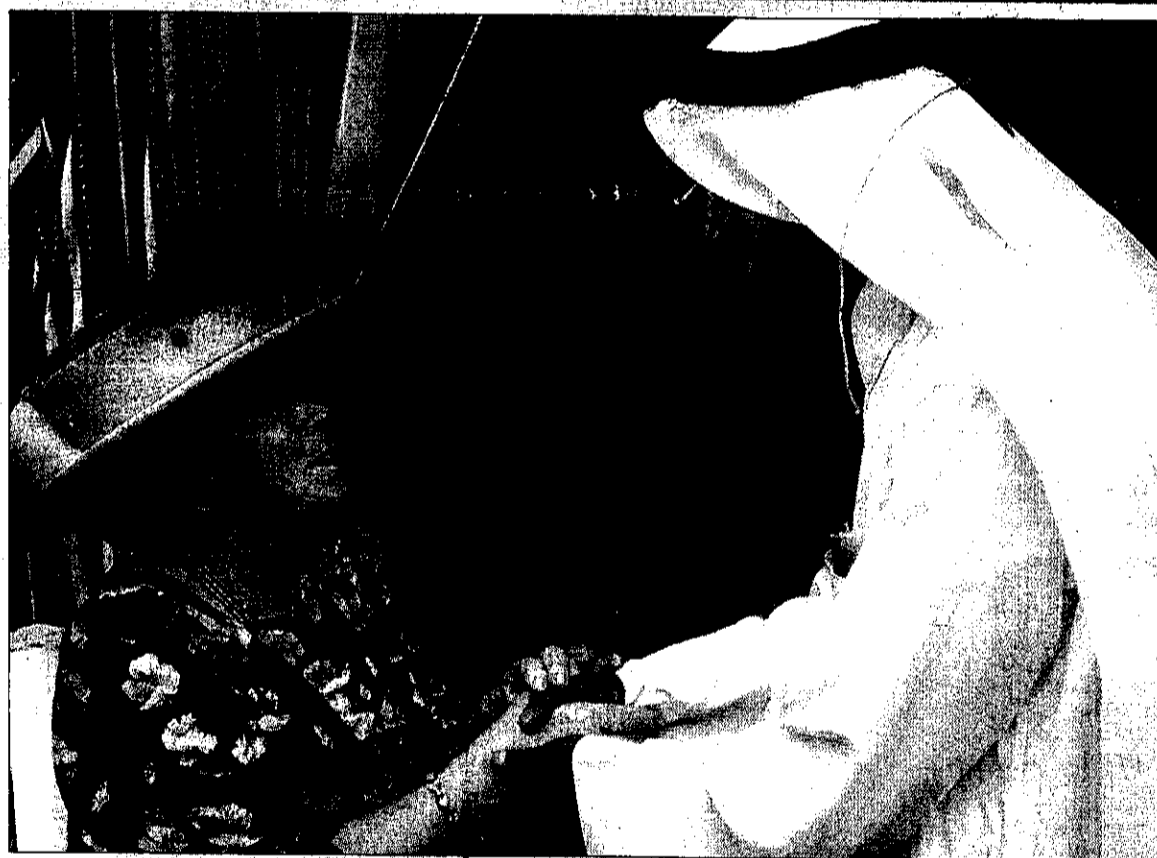
Een parelvisser heet koningin Beatrix welkom op de bazaar van de Qatarese hoofdstad Doha. De vorstin